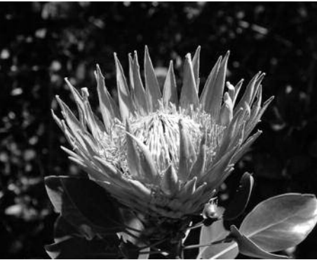
Proteaceae, die urtümliche Blume Südafrikas.

Bald wird das Augenmerk der weltweiten Fussballfans auf Kapstadt gelenkt, wo im Sommer dieses Jahres Weltmeisterschaften stattfinden.