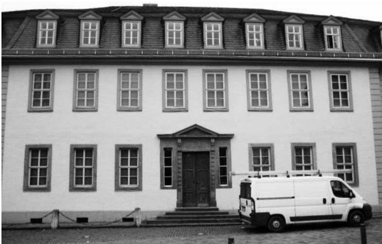
Links: Goethes Wohnhaus am Frauen- plan.