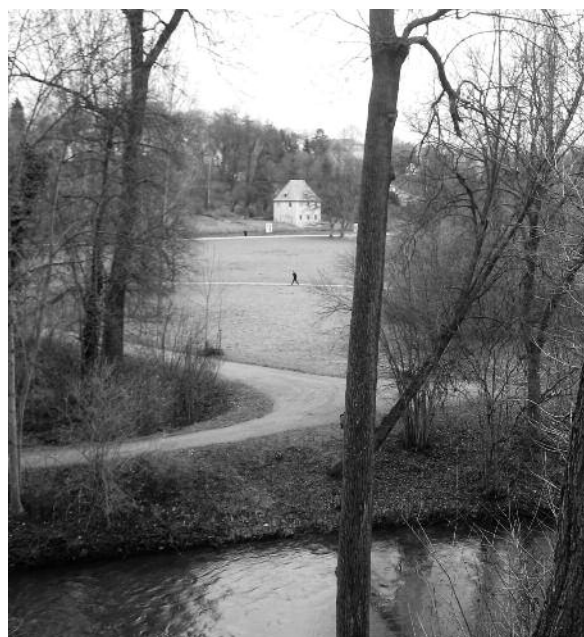
Links: Goethe-Schiller- Denkmal.