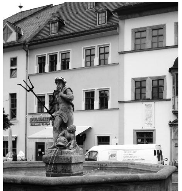
Rechts: Neptunbrunnen am Marktplatz.