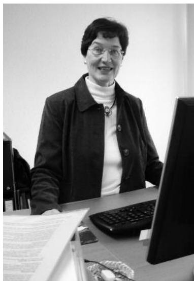
Ein Stehpult, idealer Arbeitsplatz!